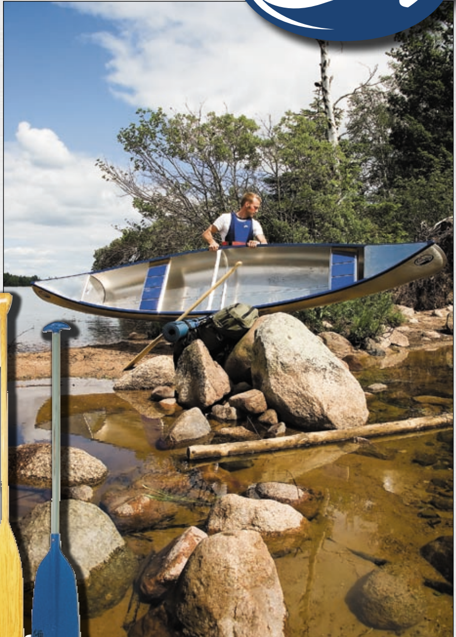
Przenoska z kanadyjką Inkas nie stanowi już problemu.

Inkas 495 – jest kierowana przede wszystkim do tych, którzy płyną we dwoje – lekka