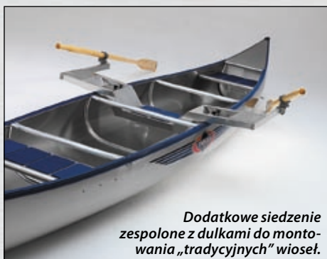
Dodatkowe siedzenie zespolone z dulkami do montowania „tradycyjnych” wiosel.

natowym czy nawet polietylenowym sprzęcie. Życie ułatwia tu nie tylko niewielka waga Inkas, ale także dodatkowe wyposażenie, np. wózki czy specjalne uchwyty naramienne.