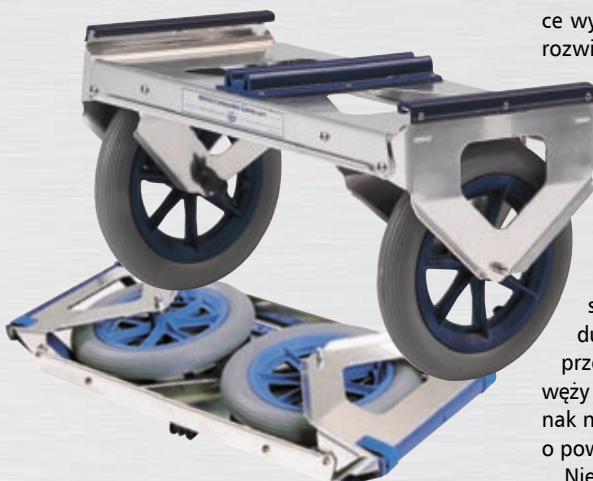
Wózek do przewożenia kanadyjki.

Aluminium jest także przyjazne dla środowiska – łatwo podlega recyklingowi, a dzięki