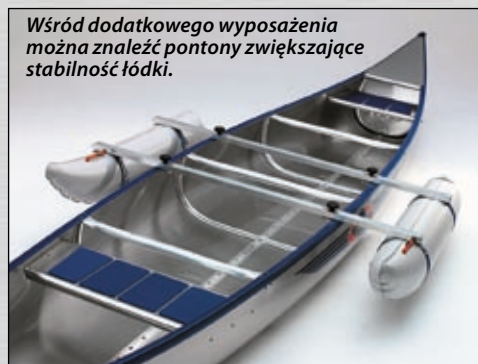
Wśród dodatkowego wyposażenia można znaleźć pontony zwiększające stabilność łódki.

Nieraz na szlaku woda dostaje się do kokpitu „z góry”. W takich momentach, gdy po-